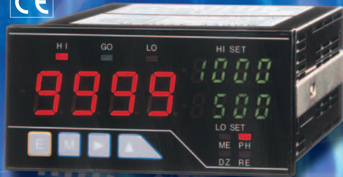
Mehrfach Display (A5X2X-XX)