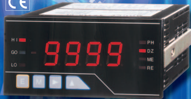
Einloch Display (A5X1X-XX)