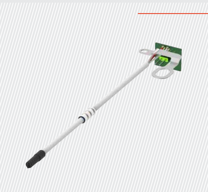
NTC Temperatursensor-Baugruppe integriert in den Stator des elektrischen Antriebsmotors