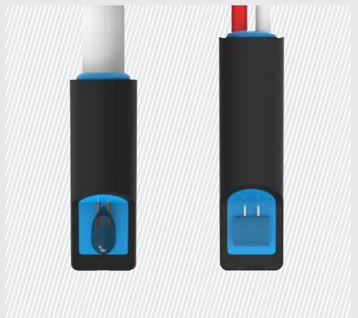
NTC Temperatursensor (Schnittbild)